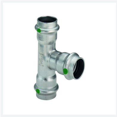
Sanpress Inox T-stuk met SC-Contur model 2318 artikel 436 049