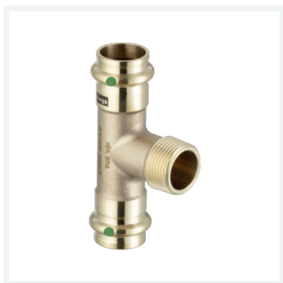
Sanpress T-stuk met SC-Contur model 2217.1 artikel 194 147