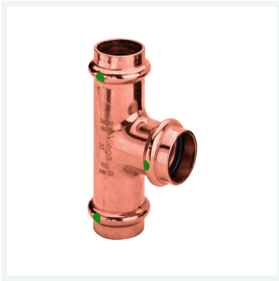
Profipress T-stuk met SC-Contur model 2418 artikel 307 899