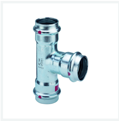
Prestabo T-stuk met SC-Contur model 1118 artikel 558 840