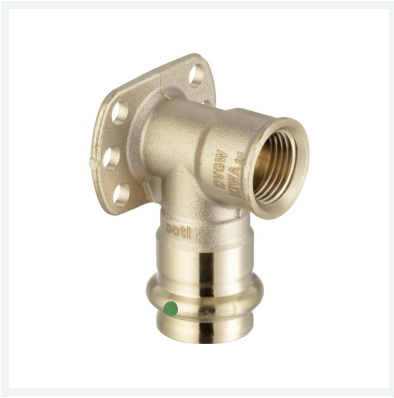
Sanpress muurplaat met SC-Contur model 2225.5 artikel 335 229